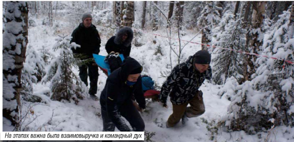
На этапах важна была взаимовыручка и командный дух

В Ухте прошел туристический слет среди молодых работников ООО «Газпром трансгаз Ухта»