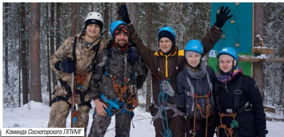
Команда Сосногорского ЛПУМГ