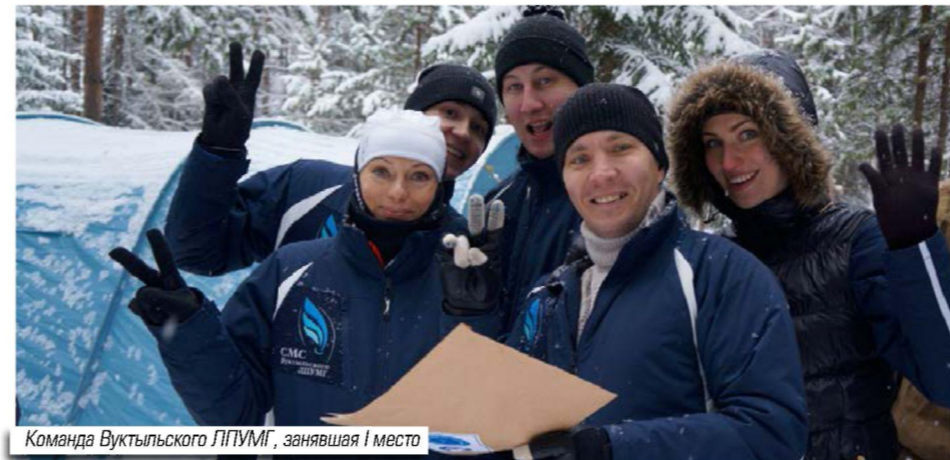
Команда Вуктыльского ЛПУМГ, занявшая 1 место

28 октября в ухтинском районе состоялся VII туристический слет филиалов северного куста ООО «Газпром трансгаз Ухта», организованный Советом молодых специалистов предприятия.