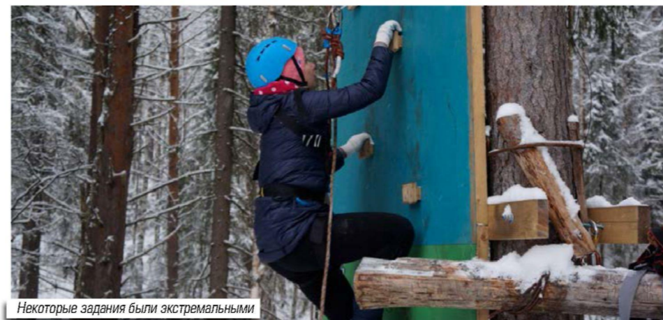
Некоторые задания были экстремальными