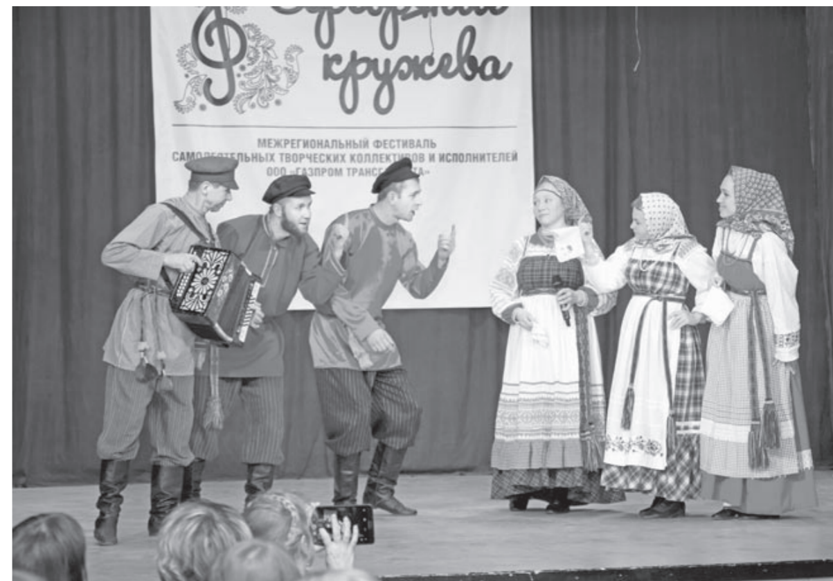
«Этностиль» от молодежи Нюксенского ЛПУМГ

Особую номинацию создали для тех, кто активно ведет шефскую деятельность. Дипломант в номинации – управление аварийно-восстановительных работ, в их зоне внимания детские социальные учреждения, находящиеся в пригородных поселках Ухты. А лауреатом стал проект «С открытым сердцем» от Сосногорского ЛПУМГ. Его сотрудники оказывают посто-