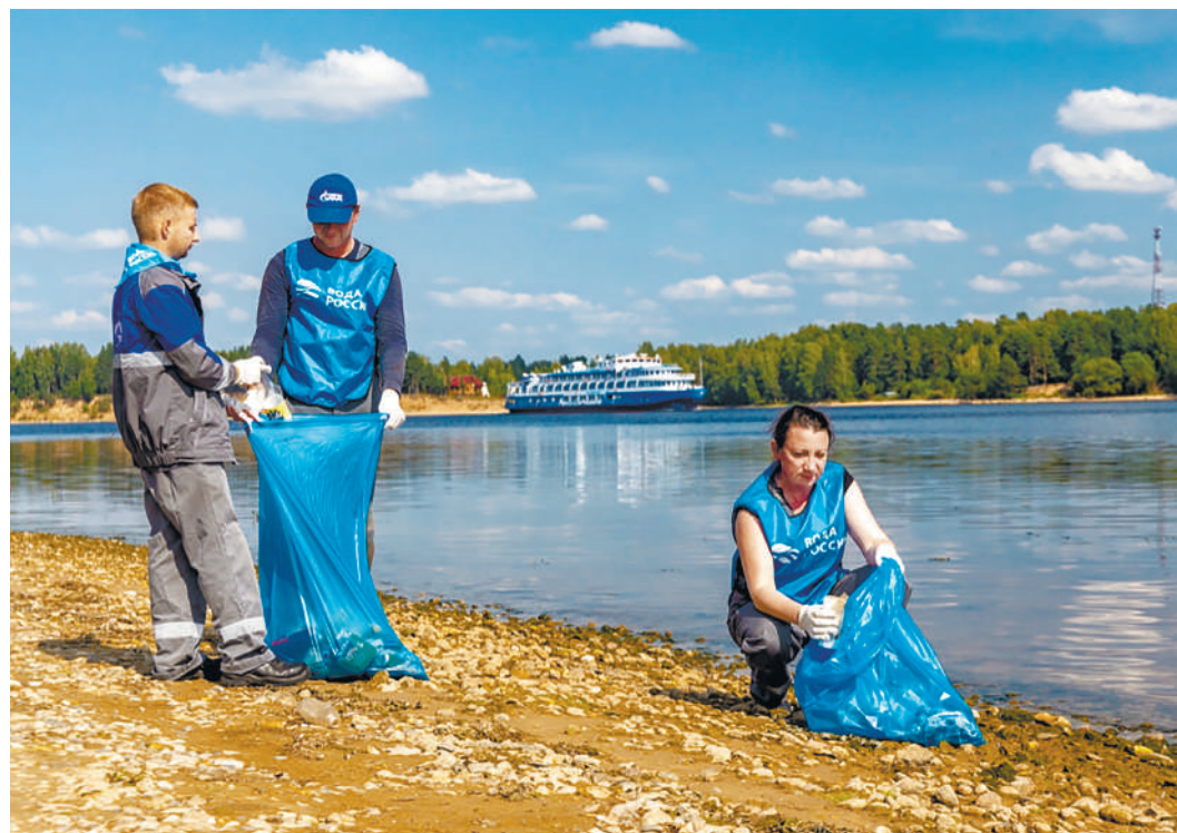
Экоактивисты Мышкинского ЛПУМГ очистили береговую полосу реки Волга

В Ярославской области акцию поддержали сотрудники Мышкинского и Переславско-