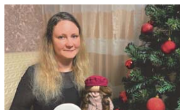
МИР УВЛЕЧЕНИЙ Вдохновляющая кулинарная магия