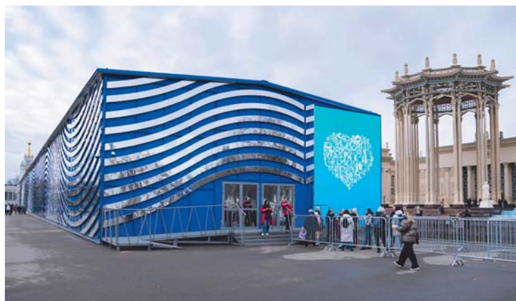
Павильон «Газпром» на выставке «Россия» поражает масштабами

С 4 ноября 2023 года по 12 апреля 2024 года в Москве проходит международная выставка-форум «Россия». Указ о проведении масштабного события подписал Президент Российской Федерации Владимир Владимирович Путин. Делегация ООО «Газпром трансгаз Ухта» приняла участие в важном мероприятии. В лектории павильона «Газпром» были представлены четыре проекта нашего предприятия.