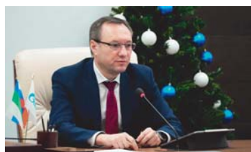
КОРОТКО О ГЛАВНОМ Продолжим работу!