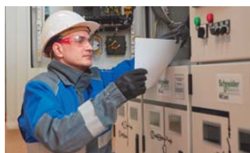
ЗНАЙ НАШИХ Команда профессионалов