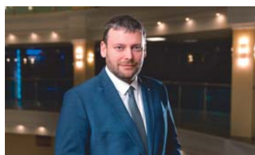
ГОСТЬ НОМЕРА Любую задачу можно превратить в достижение!