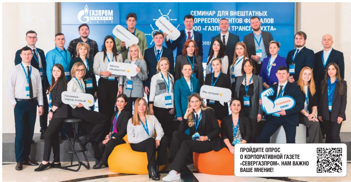
Внештатные корреспонденты ООО «Газпром трансгаз Ухта» тренируют свои навыки в написании текстов, фото- и видеосъемке на специальном семинаре

Газета «Севергазпром» – это совместное творчество службы по связям с общественностью и всех наших внештатных авторов, сотрудников отделов и служб, которые регулярно помогают нам, оказывают консультационную поддержку и делятся новостями.