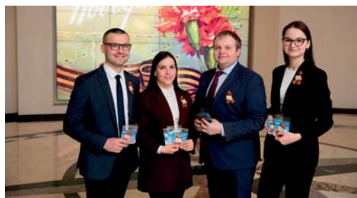
Всероссийская акция «Георгиевская ленточка»