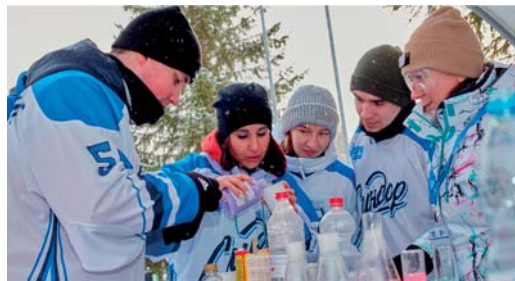
Молодёжный спортивно-патриотический фестиваль «Зимние игры»