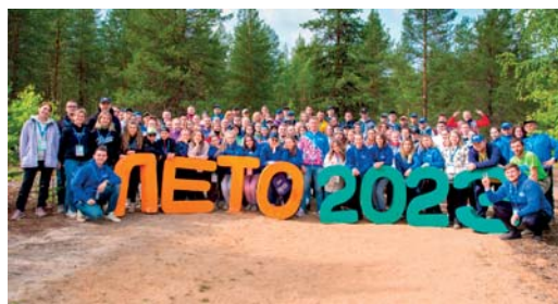
Молодёжный форум «Лето»