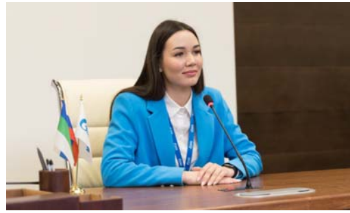
ГОСТЬ НОМЕРА В команде можно покорить любые вершины!