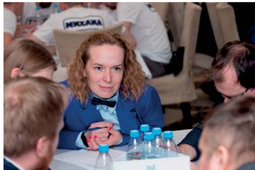
Команда «451°F», Юбилейное ЛПУМГ, 3 место