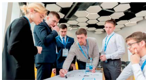
Семинар-совещание председателей Советов молодых специалистов филиалов