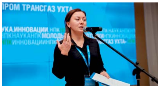
Научно-практическая конференция молодых работников