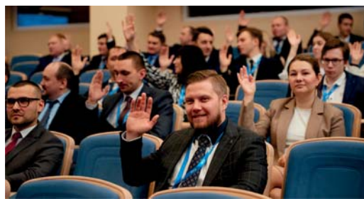
Отчётно-выборная конференция Совета молодых специалистов предприятия