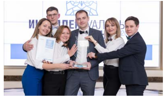
НЕ ГАЗОМ ЕДИНЫМ Битва эрудитов: итоги интеллектуального турнира