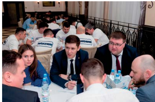
Команда «Восьмое правило Газлайтинга», администрация и подразделения при администрации, 2 место