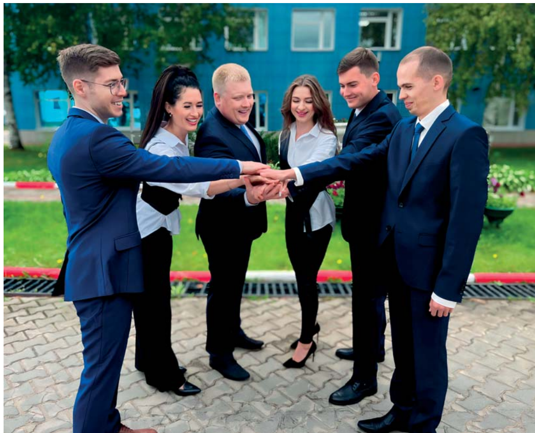
Молодые специалисты Приводинского ЛПУМГ