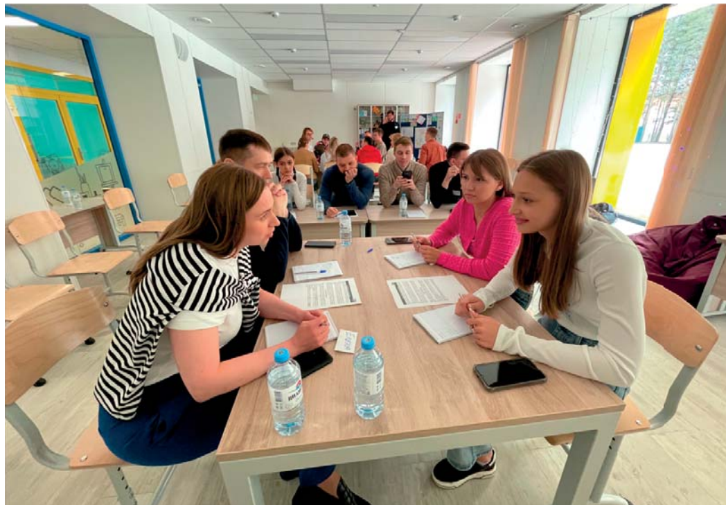
«Переговоры?» объединили молодёжь предприятия и учеников Ухтинского технического лицея им. Г.В. Рассохина