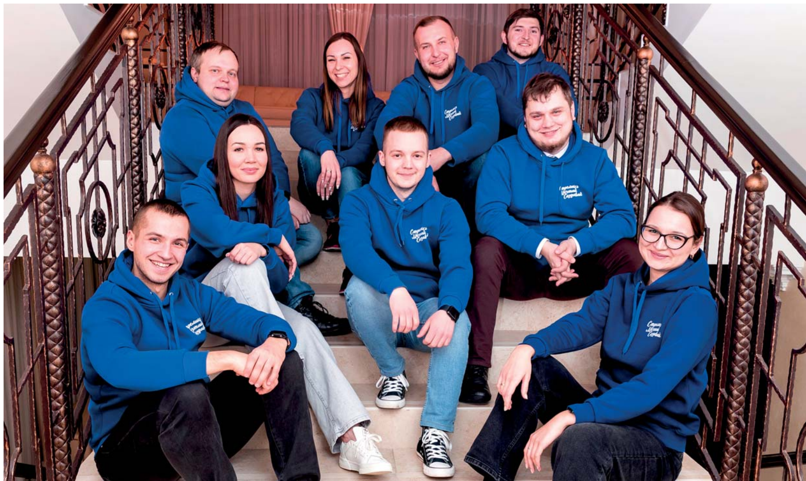
Актив Совета молодых специалистов ООО «Газпром трансгаз Ухта»

Совет молодых специалистов ООО «Газпром трансгаз Ухта» ежегодно проводит более десятка мероприятий научной, социальной, спортивной и культурной направленности. Активисты и волонтеры принимают участие в социальных и благотворительных акциях, меняя жизнь людей к лучшему, поддерживая тех, кто оказался в сложной ситуации, нуждается в помощи и человеческом участии. Пусть календарь главных событий «молодёжки» на 2024 год станет путеводной звездой для всех сотрудников нашего предприятия. Внизу страницы также представлены полезные ссылки. Присоединяйтесь к добрым делам, даже если формально вышли из «комсомольского» возраста, ведь наши души остаются вечно молодыми!