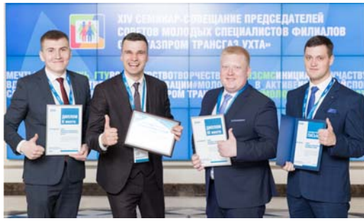
КОРОТКО О ГЛАВНОМ Советы молодости нашей