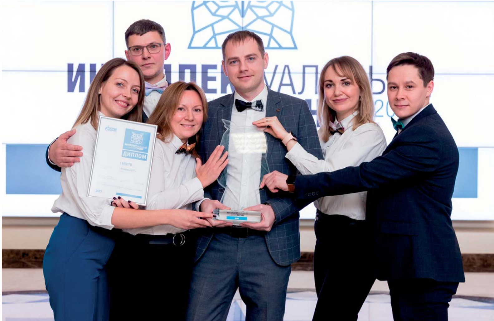
Команда «Отойти от IT», Служба информационно-управляющих систем администрации, 1 место

12 декабря состоялся финал интеллектуального турнира среди команд молодых работников нашего предприятия. За кубок главного эрудита боролись 12 команд, показавших лучшие результаты в полуфинале.