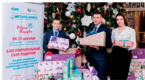
Благотворительная акция «Праздник – детям»