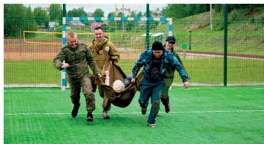
Летняя спортивно-патриотическая игра «Зарница»