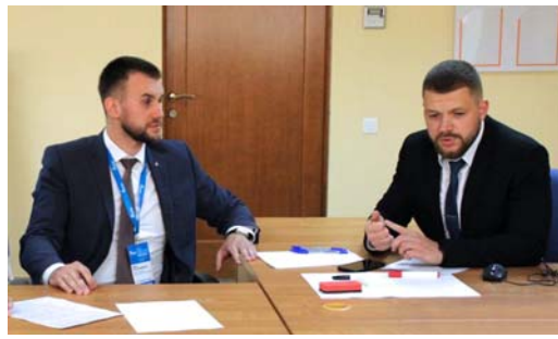
СЛОВО ИНЖЕНЕРУ Цифровой двойник надёжности