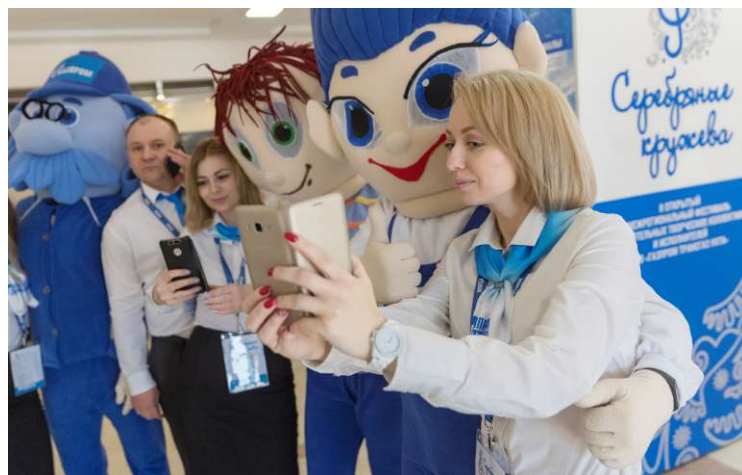
Волонтеры задают настроение...

Волонтерский коллектив объединил ребят разных профессий. Тех, кто уже имеет опыт проведения подобных мероприятий, и тех, кто пробует в этом свои силы впервые. И все они говорят о бесценном профессиональном и нравственном опыте, о возможности попробовать себя в новом деле.