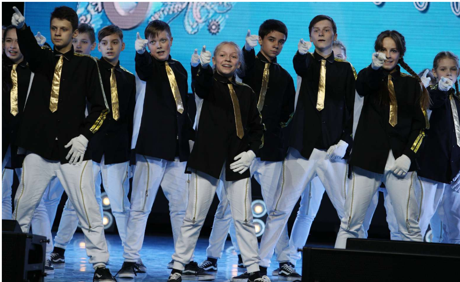
Танцевальный коллектив «United BIT», администрация