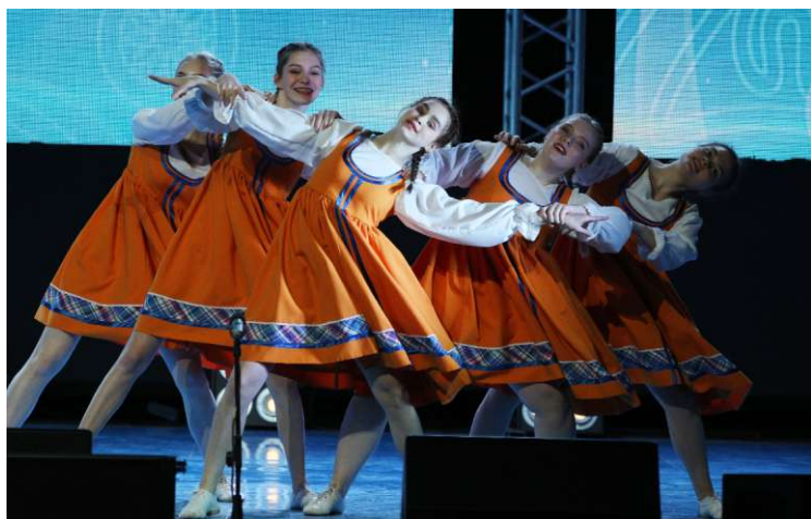
Народный коллектив ансамбль танца «Метаморфозы», г. Ухта