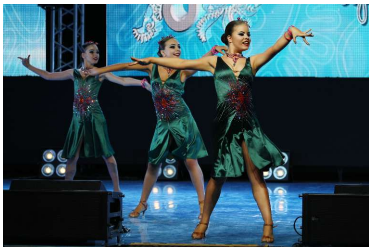
Образцовый ансамбль бального танца «Фейерверк», УТТиСТ