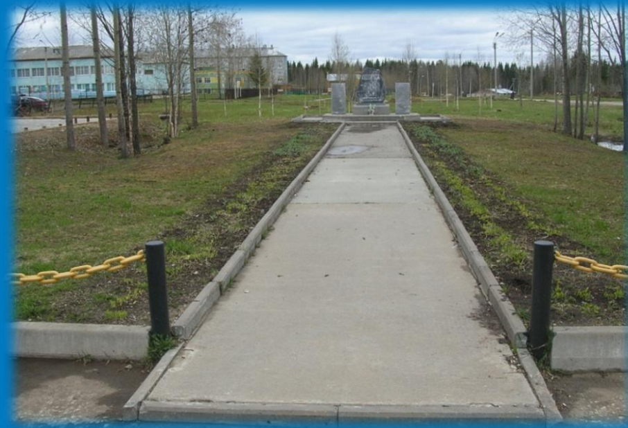
Фото 2. Пешеходная дорожка к мемориальному комплексу Память

В шаговой доступности находятся администрация поселка, физкультурно - оздоровительный комплекс, школа, отделение почты и кафе «Современник».