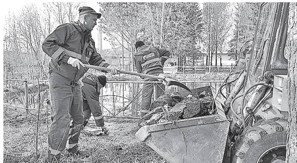
Очищены территории шести населенных пунктов.

Материал подготовлен службой по связям с общественностью и СМИ ООО «Газпром трансгаз Ухта»