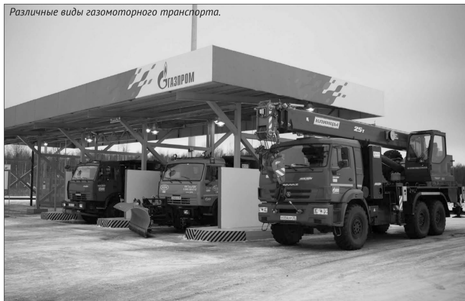
Различные виды газомоторного транспорта.