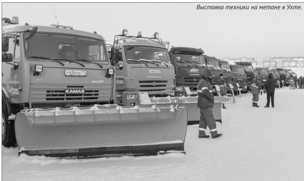
Выставка техники на метане в Ухте.

Все желающие могли проконсультироваться у специалистов ООО «Газпром трансгаз Ухта», получить ответы на вопросы об особенностях эксплуатации техники на газомоторном топливе, подго-