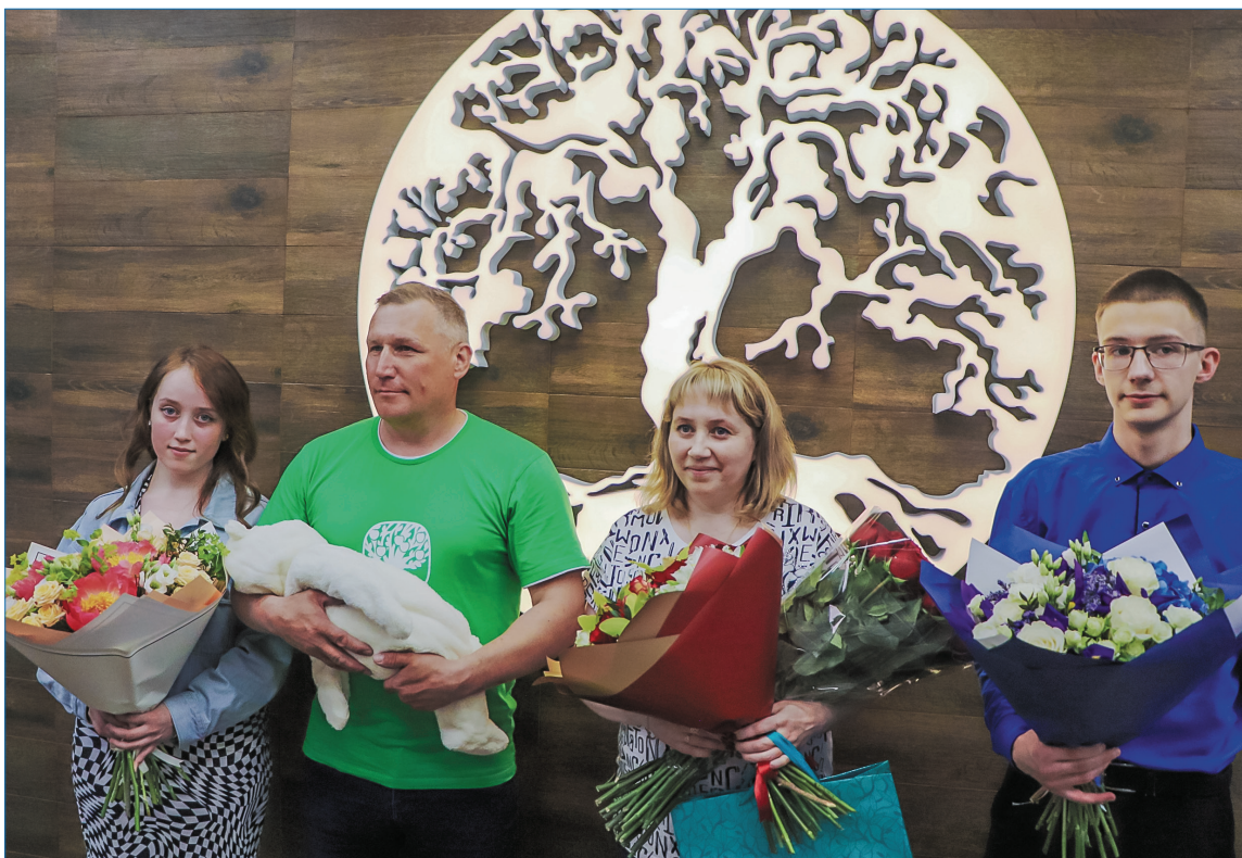
В семье из Брыкаланска родился пятый ребенок

«Благодаря сплочённой работе большой команды: правительства, строителей, медперсонала,