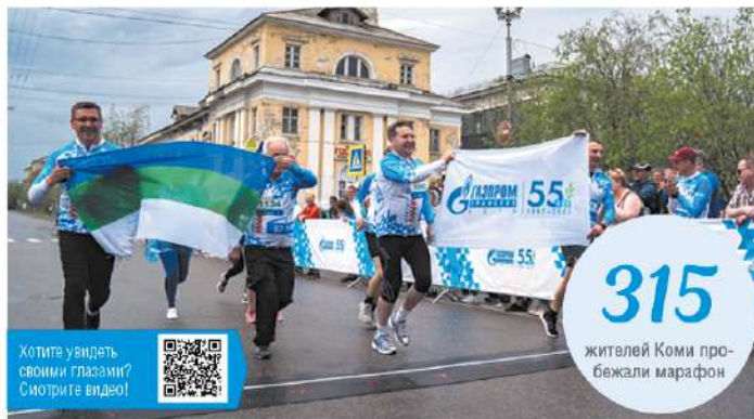
Хотите увидеть своими глазами? Смотрите видео!

Специальный гость мероприятия – олимпийский чемпион, чемпион мира и Европы, двенадцатикратный чемпион России по бегу на 800 и 1500 метров, заслуженный мастер спорта России, спортивный директор Всероссийской федерации легкой атлетики Юрий Борозковский. «Само нахождение здесь,