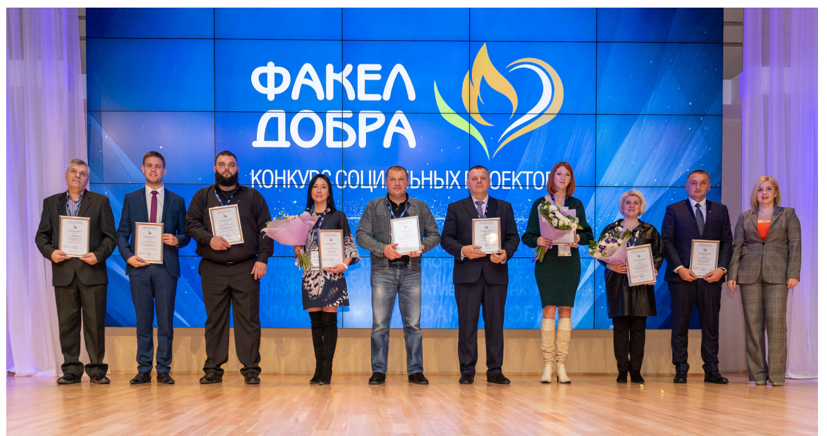
Девять волонтеров общества получили в этот день благодарственные письма от Общественной палаты РФ.