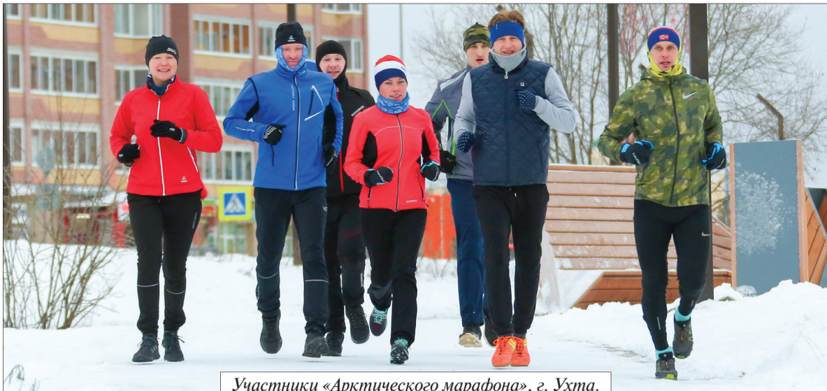
Участники «Арктического марафона», г. Ухта.