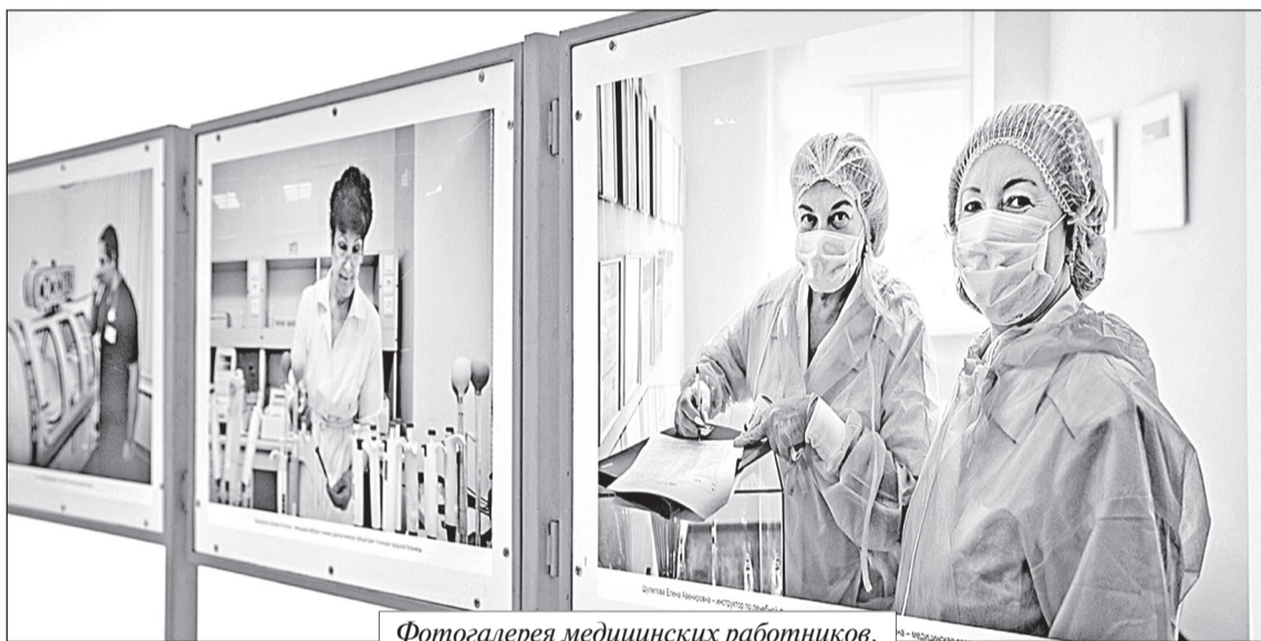
Фотогалерея медицинских работников.

Внутрикорпоративный проект «С благодарностью и уважением» объединил работников компаний группы «Газпром», а также их детей общей идеей – передать свои чувства признательности людям, которые заботятся о нашем здоровье. В рамках проекта дети работников из 39 дочерних обществ и организаций ПАО «Газпром» создали рисунки, посвященные труду врачей, а работники компании – участники фестиваля «Факел» написали песню и сняли