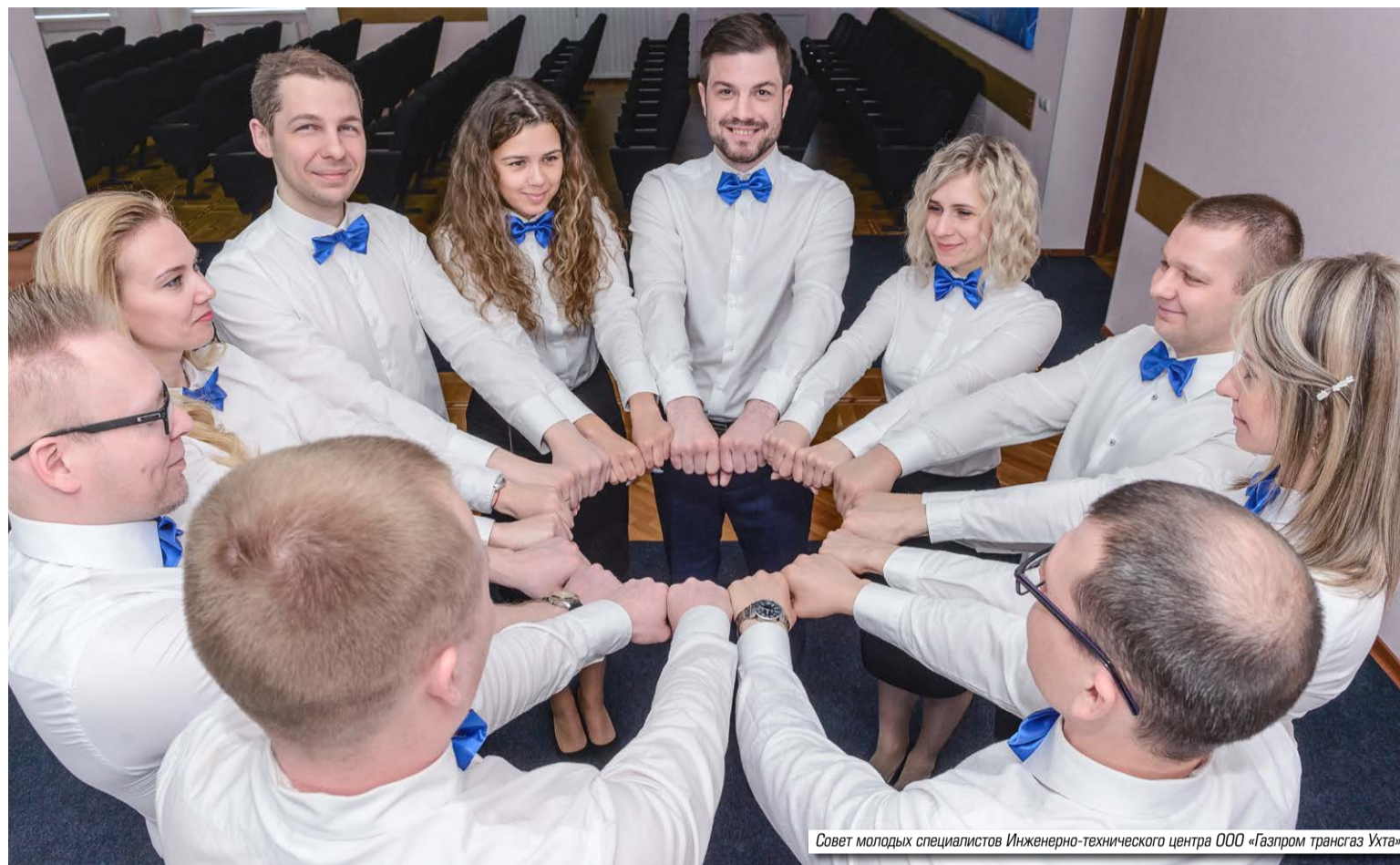
Совет молодых специалистов Инженерно-технического центра ООО «Газпром трансгаз Ухта»

В этом году конкурс проводился в два тура, по итогам первого были отобраны пять Советов молодых специалистов, во втором туре после презентационных докладов комиссия определила лучшие молодёжные движения. Работа Советов оценивалась по активности и эффективности в нескольких направлениях: информационном, научно-техниче-