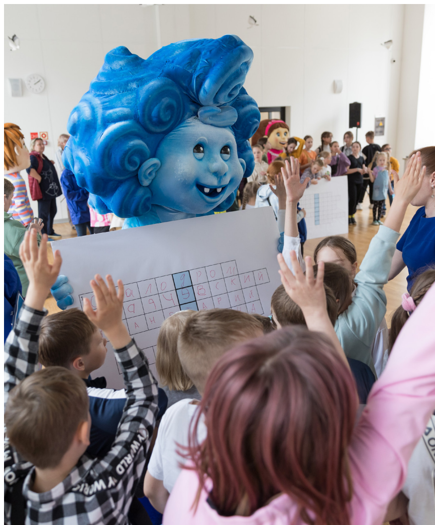
Дети разгадали кроссворд о Центре творчества им. Г.А. Карчевского

Отсканируйте QR-код и смотрите видеорепортаж о мероприятии «Территория детства»