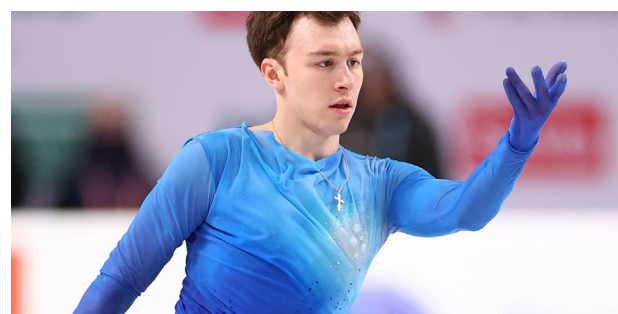
Подпись • Фото

Министерство спорта РФ опубликовало список кандидатов в сборную России по фигурному катанию на сезон-2023/24. Опубликован состав сборной РФ по фигурному катанию на следующий сезон, в который был включён ухтинец Дмитрий Алиев. Все знают его как фигуриста, который выступает в мужском одиночном катании. Он чемпион Европы, серебряный призёр чемпионата Европы. Чемпион России и бронзовый призёр чемпионата России. 24-летний спортсмен представлен в списке мужского одиночного основного