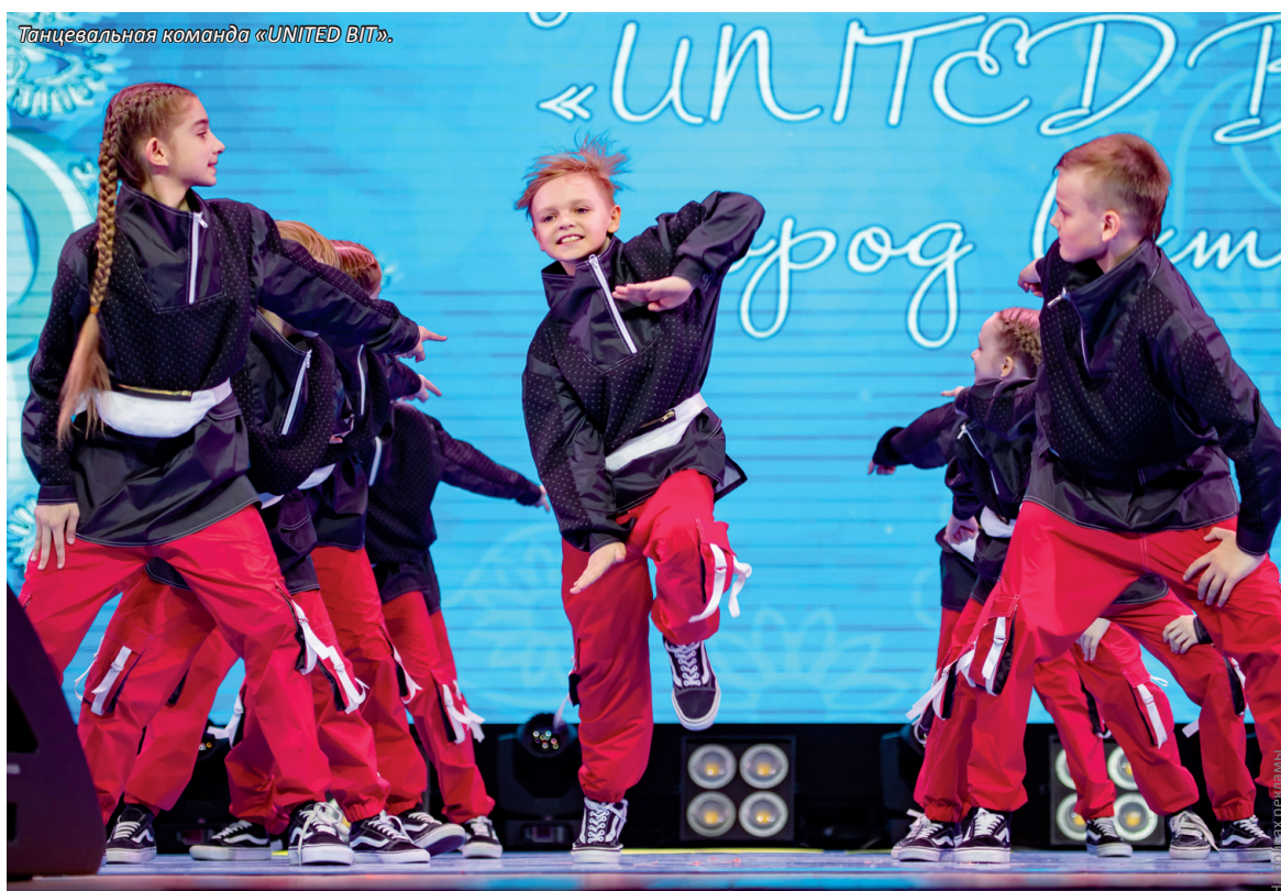
Танцевальная команда «UNITED BIT».