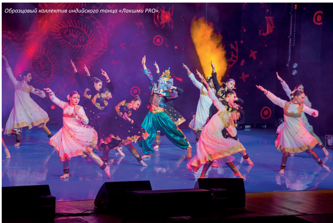
Образцовый коллектив индийского танца «Лакшми PRO».