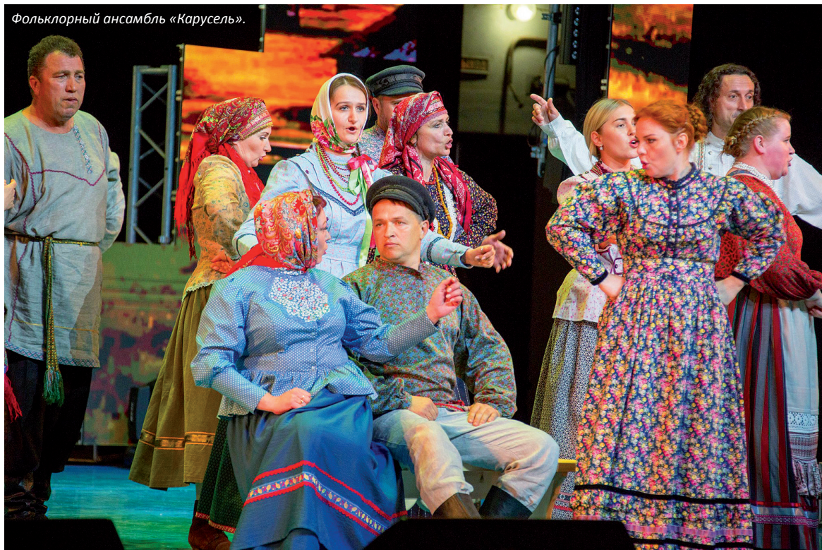
Фольклорный ансамбль «Карусель».

В Ухте прошел межрегиональный фестиваль творческой