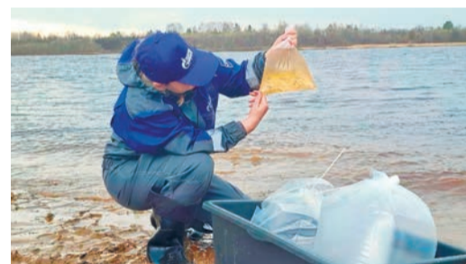
Выпуск мальков в воды реки Вычегды