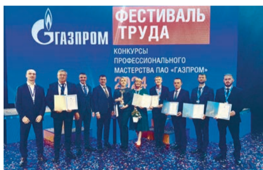
АКТУАЛЬНО Признание профессионализма