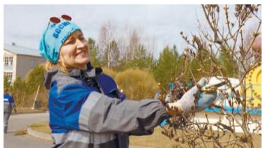
Сотрудники Нюксенского ЛПУМГ поддержали акцию «Зелёная весна»

Ирина Вылегжанина, фото из архива филиалов