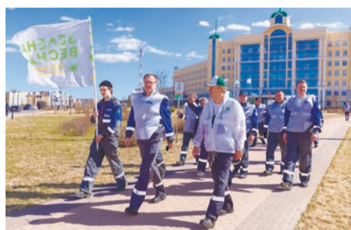
ЭКОЛОГИЯ Делаем мир чище вместе