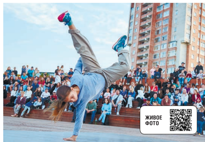
«Активное поколение» объединило на ухтинской набережной Газовиков любителей и профессионалов в различных видах спорта

Отдельным событием этого дня стал семейный велопробег. Около 400 участников колонной проехали по главным улицам города. В финале всех зарегистрированных участников ждала лотерея и главный приз – велосипед, новым