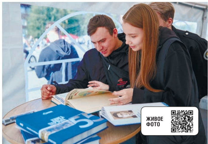
Встреча поколений на фестивале «Книжная жемчужина – 2024»

Фестиваль «Книжная жемчужина», который уже второй год подряд проводится в Ухте в рамках профессионального праздника газовиков и нефтяников, а в этом году ещё и 95-летнего юбилея города, в 2024 году приобрёл название и фирменный стиль, стал масштабнее, объединив 13 авторов, три издательства, четыре республиканских учреждения культуры, и принял более двух тысяч посетителей.