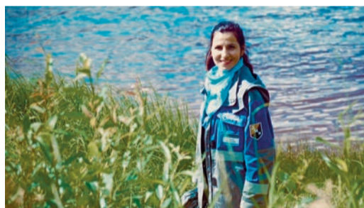
Активисты Микуньского ЛПУМГ присоединились к экологической акции «Речная лента»