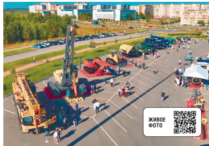
Уникальная выставка техники и оборудования – «изюминка» праздничных мероприятий

Кроме того, специалисты отдела надёжности конструктивных элементов Инженерно-технического центра представили образцы различных дефектов, вырезанных из газопроводов, эксплуатируемых нашим предприятием: