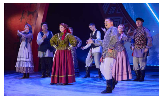
Фольклорный ансамбль «Карусель» (Мышкинское ЛПУМГ) представил колоритное попурри из народных песен