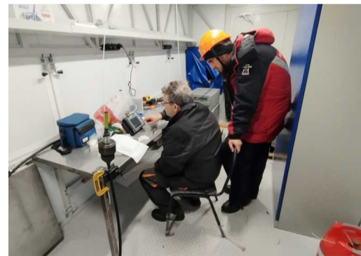
Измерение параметров оптического кабеля, поднятого со дна акватории