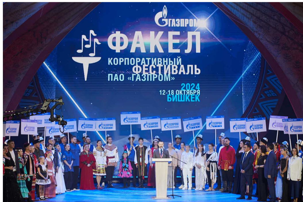
Фольклорный ансамбль «Карусель»

2024 год ознаменован стартом нового двухгодичного цикла и двадцатилетием корпоративного фестиваля самодельных творческих коллективов ПАО «Газпром» «Факел». По традиции первый фестивальный этап – творческие состязания в зональных турах, прошедших в этот раз в российской Самаре и заграничном Бишкеке. На каждой из площадок царил атмосфера многонационального праздника, было представлено разнообразие жанров и направлений. Делегации нашего предприятия по итогам жеребьевки, состоявшейся в финале фестиваля в прошлом году, выпало стать участником «северной» зоны и отправиться с 12 по 18 октября в сердце Центральной Азии, в столицу Кыргызской Республики.