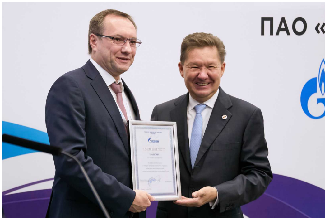
Вручение ценной награды генеральному директору ООО «Газпром трансгаз Ухта» Председателем Правления ПАО «Газпром» Алексеем Борисовичем Миллером

«Выполнение нашей основной задачи по обеспечению надёжной транспортировки газа потребителям сопровождается постоянным внедрением современных технологий, совершенствованием процессов, поиском наиболее эффективных методов. При этом работа в нынешних условиях реализации масштабной программы импортозамещения, курса на достижение технологического суверенитета и технологического лидерства требует