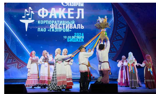
Образцовый детский фольклорный ансамбль «Боркунцы» (Нюксенское ЛПУМГ) показал зарисовку «Дождюшки»