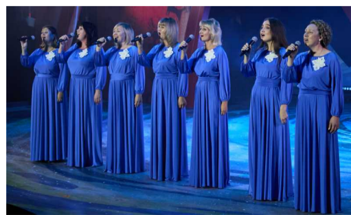
Признание в любви к малой родине в исполнении женского вокального ансамбля «Созвучие» (Шекнинское ЛПУМГ)