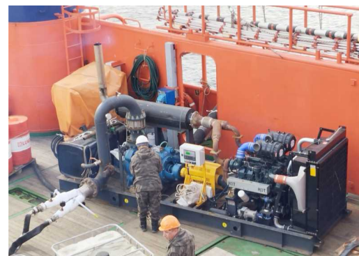
Работа представителей подрядной организации с компрессором