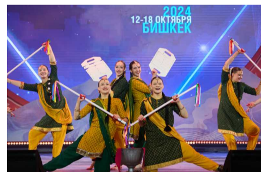
Образцовый художественный коллектив индийского танца «Лакшми» (Приводинское ЛПУМГ) познакомил с культурой Индии