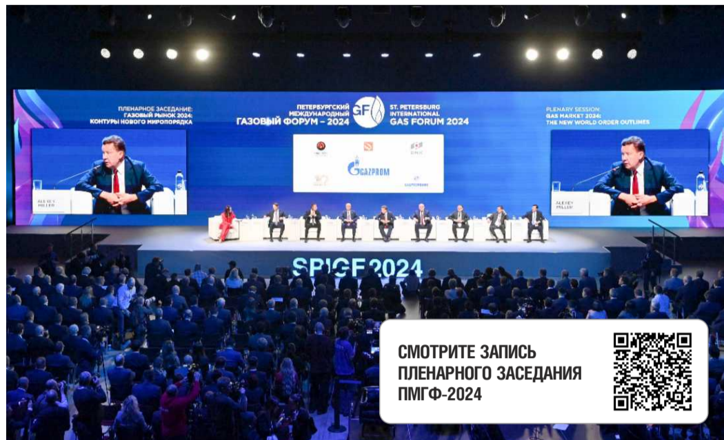
Пленарное заседание ПМГФ-2024 «Газовый рынок 2024: контуры нового миропорядка»

Представители государств из других регионов заявили о том, что самодостаточность собственных газовых отраслей не отменяет необходимости всемерно развивать партнерские от-