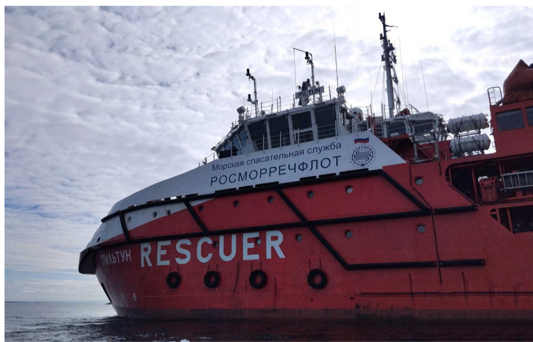
Судно «Пильтун», с использованием которого велись работы по восстановлению кабельной линии

На Байдарацкой губе Карского моря выполнены работы по восстановлению уникальной волоконно-оптической линии связи, проложенной в грунте по дну акватории. В течение двух месяцев работники предприятия в команде с глубоководными водолазами специализированной организации и экипажем судна «Пильтун» боролись с климатическими условиями, чтобы наладить связь.