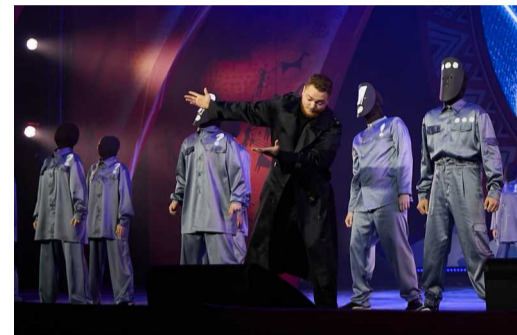
Танцевальная команда «Юнайтед БИТ» (администрация) с номером «Мысли»