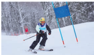
Состязания по слалому в номинации «Горные лыжи»