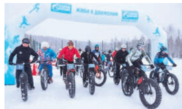
ВОКРУГ СПОРТА Активный отдых – активная жизнь!