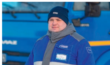
НАШИ ЛЮДИ «Моя машина – отражение меня»