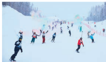
Массовый спуск с горнолыжного склона

Традиционно праздник начался на основном склоне уникальной интерактивной программой: в специально выделенной зоне каждый желающий мог проехать на сноуборде или горных лыжах и выполнить задания на координацию и ловкость от опытных инструкторов школы «DOSKI».