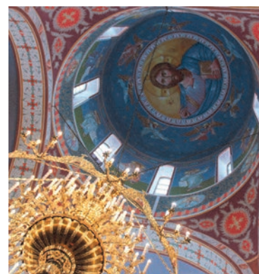
Купол храма венчает образ Спас Вседержителя