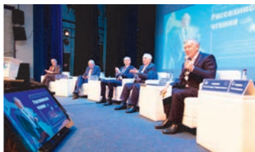
АКТУАЛЬНО «Рассохинские чтения»: вызовы и решения