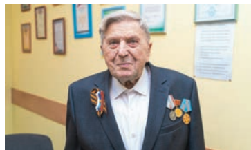
МЫ ПОМНИМ! МЫ ГОРДИМСЯ! Свидетель эпохи