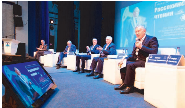
Пленарное заседание в рамках конференции «Рассохинские чтения»

Представители ООО «Газпром трансгаз Ухта» приняли участие в ежегодной международной конференции «Рассохинские чтения». Ведущие эксперты нефтегазовой отрасли традиционно встретились на базе Ухтинского государственного технического университета – опорного вуза компании «Газпром» – для обсуждения актуальных научно-технических задач, обмена опытом и формирования новых тем исследований.