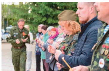
Сотрудники Микуньского ЛПУМГ и жители г. Микуня на Всероссийской акции «Свеча памяти», посвящённой жертвам Великой Отечественной войны