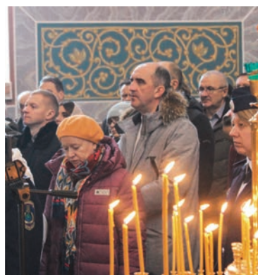
Прихожане на торжественном мероприятии, посвящённом освящению храма после росписи