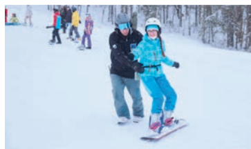
Мастер-класс по основам катания на сноуборде