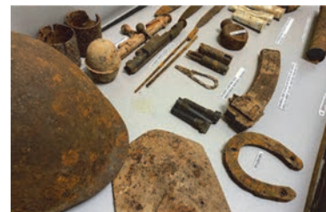
Экспонаты, найденные участниками поискового отряда в ходе «Вахты памяти»