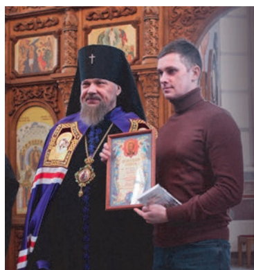
Награждение епархиальными медалями и грамотами сотрудников предприятия за помощь в реализации проекта