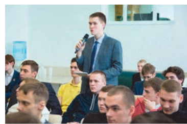
«Рассохинские чтения» – площадка для диалога поколений и обмена опытом