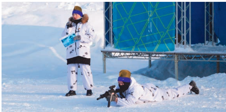
Команда Управления материально-технического снабжения получила приз за самую оригинальную визитку

«В соревнованиях я участвую третий год, но каждый раз организаторы не перестают удивлять нас новыми испытаниями. В этом году одним из самых запоминающихся этапов стал забег на горнолыжный спуск. Сделать это было непросто! В руках участников были флаг и ватрушка. Однако у нашей команды все получилось. Нам наконец-то удалось победить! Эмоции переполняют, ведь победа – кульминация наших совместных усилий!» –