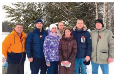
Совет молодых специалистов Микуньского ЛПУМГ на возложении цветов к мемориальному комплексу погибшим в Великой Отечественной войне в г. Микуне

Анна Соймонова