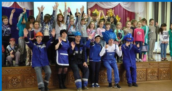
Театрализованная постановка «Путешествие с Северным газом»