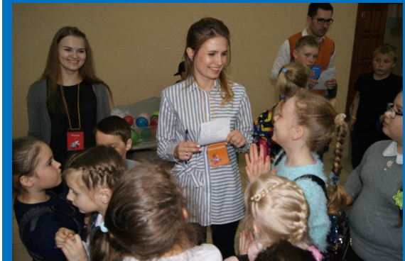
Квесты приуроченные ко дню защиты детей