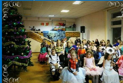
Сказка «Операция похищения»