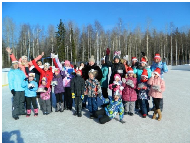
07.03.2019г. «Семейный старты» Юбилейная СОШ