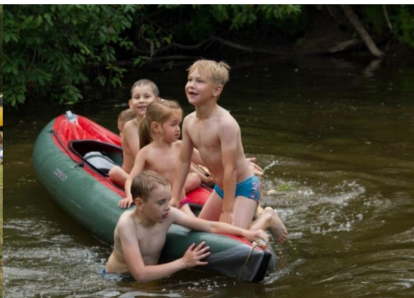
«Россия глазами детей»

07.06.2019г. Квест «Сундучок с подарками»