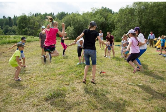
«Сказка моей мечты»