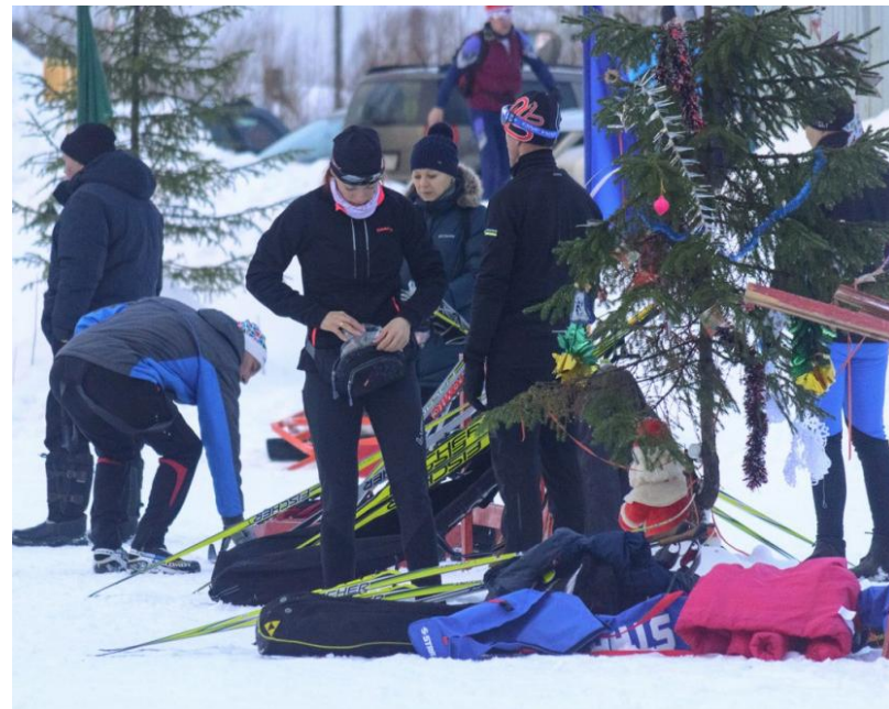
Команда Вуктыльского ЛПУМГ