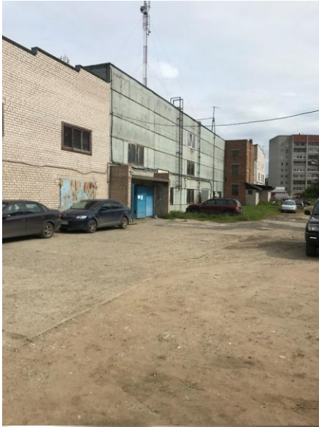
Левый въезд в комплекс