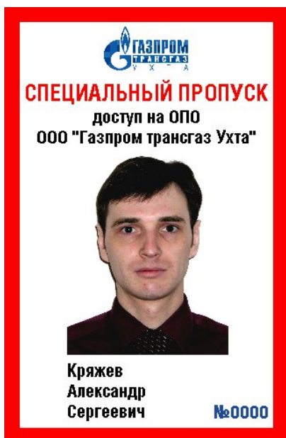
Рисунок Д.3 – Пример специального пропуска