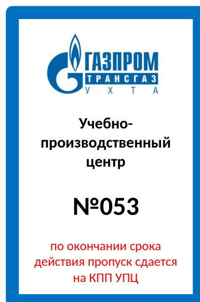
Рисунок Д.4 – Форма временного пропуска на карте доступа

Допускается нанесение отличительной полосы вручную красным маркером.