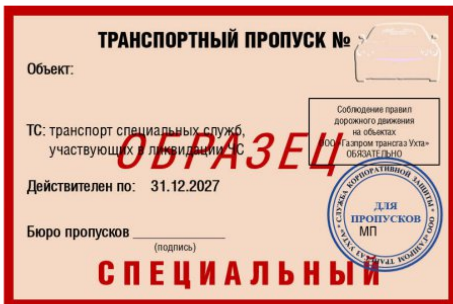
Рисунок Д.9 – Образец транспортного специального пропуска

Транспортный пропуск выдается отдельно на каждую транспортную единицу. Размер пропуска 120x80 мм.