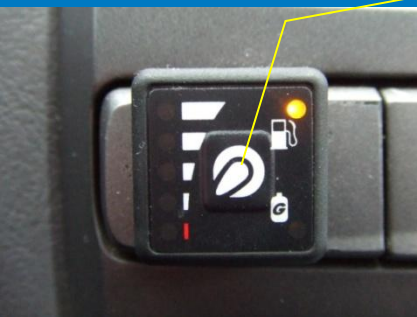
Кнопка управления газ/бензин