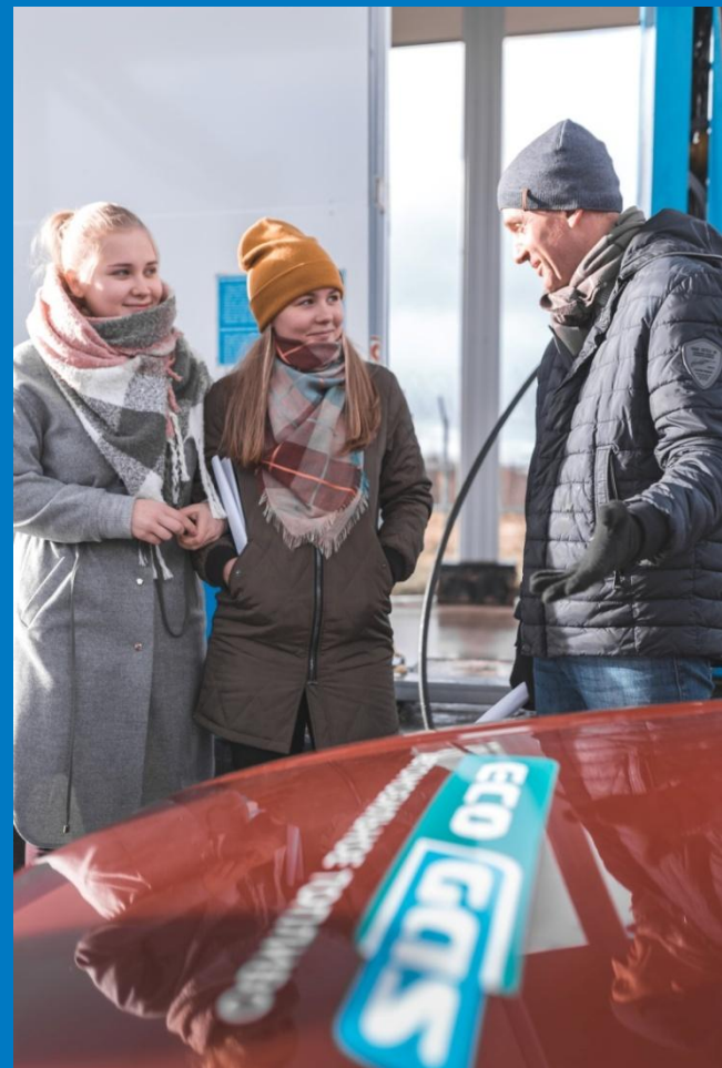
Экскурсия на АГНКС