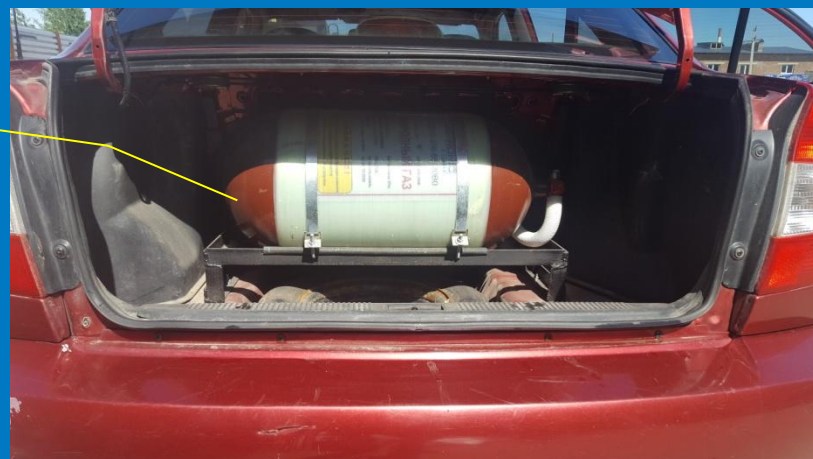
Баллон с 3А

Данный автомобиль очень удобен для показа в качестве учебной модели, так как имеет отличный обзор узлов и элементов ГБО.