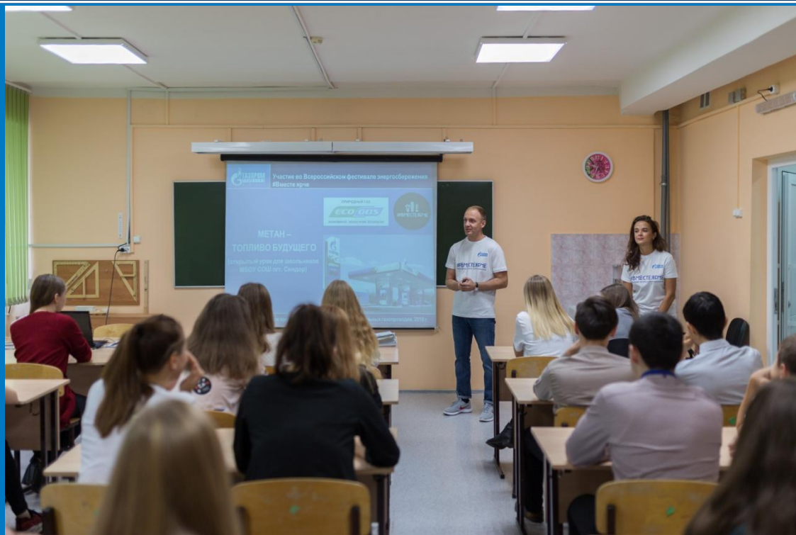
Демонстрация презентации «Метан - топливо будущего»

Затем была проведена уличная демонстрация личных автомобилей сотрудников филиала и организована экскурсия школьников на производственный объект ЛПУМГ – АГНКС.