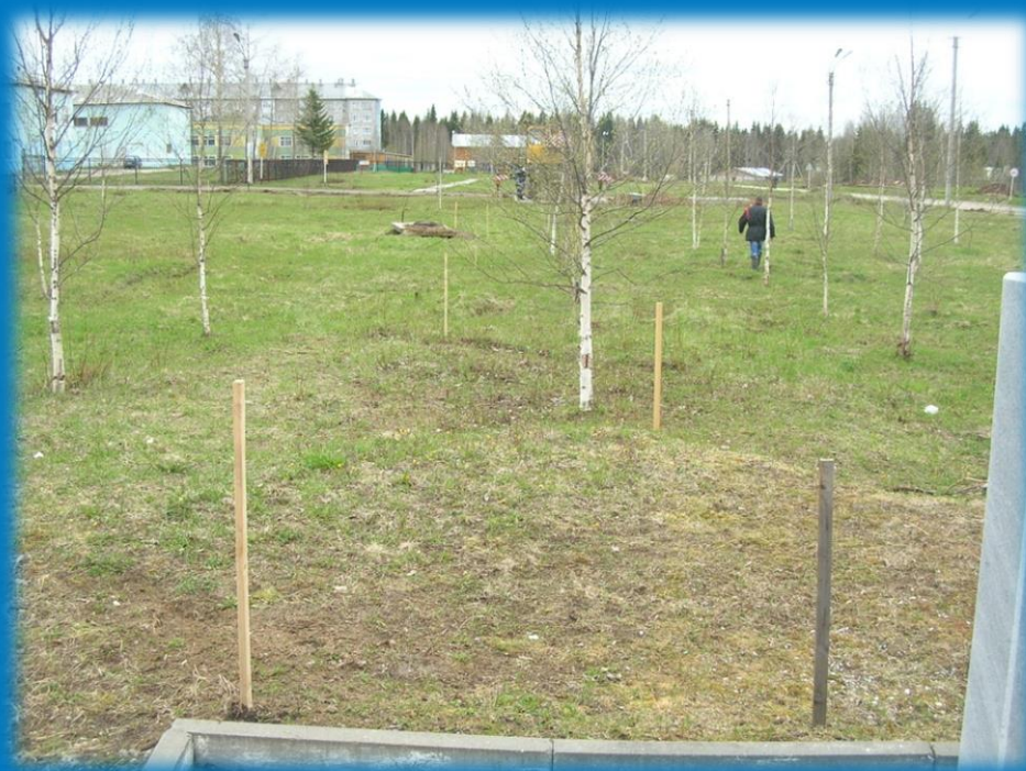
Фото 3. Разметка территории строительства

В 2016 году руководством Синдорского ЛПУМГ было принято решение о вовлечении части финансовых средств, собранных в рамках марафона на строительство сквера.