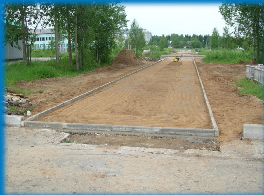
Фото 4. Промежуточный этап СМР

В 2017 году была разработана смета на СМР, закуплена брусчатка и бордюрный камень. В 2018 году были приобретены парковые скамейки.