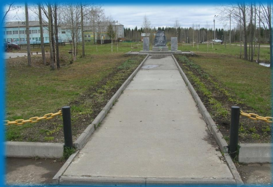
Фото 2. Пешеходная дорожка к мемориальному комплексу Память

В шаговой доступности находятся администрация поселка, физкультурно - оздоровительный комплекс, школа, отделение почты и кафе «Современник».