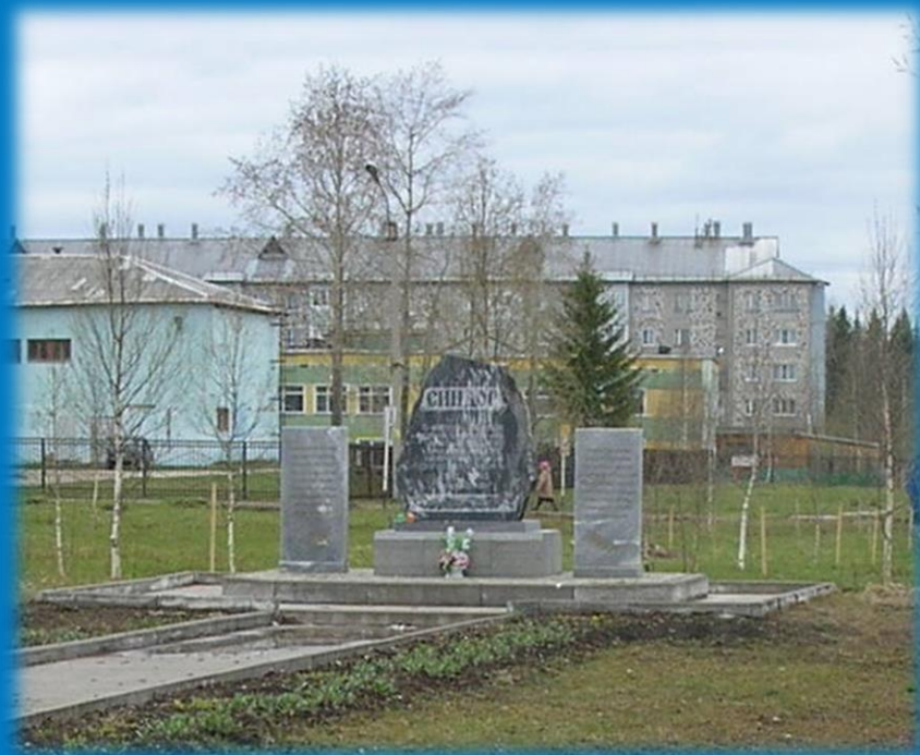
Фото 1. Мемориальный комплекс Память

22 июня 2015 года в День памяти и скорби возле Камня “Память” были установлены 2 гранитные плиты с фамилиями воинов. С этого дня мемориал стал носить название – мемориальный комплекс Память.