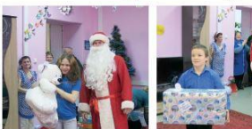
Специальный № 1 (64) января 2017 г. Газета «Тепло наших сердец»

В науку нового года работники нашей предприятия провели масштабную акцию. «Тепло наших сердец» – это организация Службой по связям с общественностью и СМИ, помощью в проведении оказывает ИТМО-Газпром трансгаз Ухта Профсоюз. Акция призвана объединить младше и старшее поколение людей: одиноких пожилых людей, ветеранов Великой Отечественной войны, детей, оставшихся без попечения родителей, воспитанников детских учреждений и молодых мамочек.