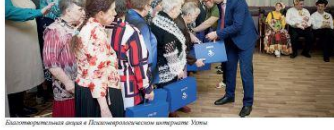
Специальный № 1 (64) января 2017 г. Газета «Тепло наших сердец»

В Архангельской области работники Приволжского ЛПУМГ и специалисты Правильной средней общеобразовательной школы посетили Тургорский психоневрологический интернат, а главными из Урала посетили Совет ветеранов.