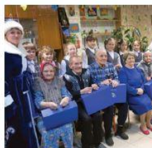
Специальный № 1 (64) января 2017 г. Газета «Тепло наших сердец»

Новый год – это домашнее тепло, близкие люди, ожидание чуда. Для тех, кто в этот год встретит его без поддержки своих родных, мы подарим Тепло наших сердец.