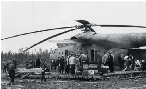
ЮБИЛЕЙ Вуктыльскому ЛПУМГ – 50 лет