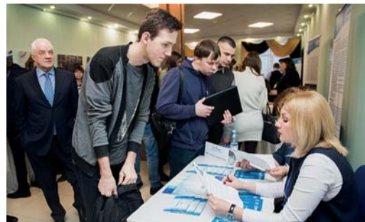
СИЛА В РАЗВИТИИ Кадры решают все