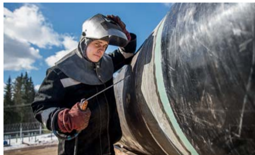
НАШИ ЛЮДИ Один день со сварщиком