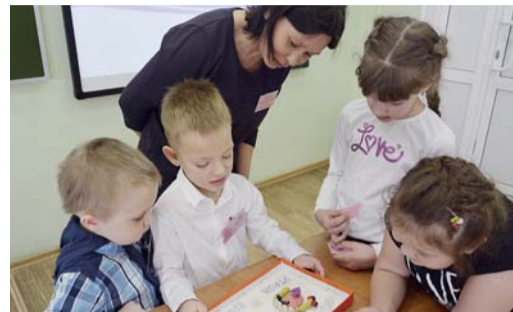
ДЕТИ В ПРИОРИТЕТЕ «Совята» учатся летать