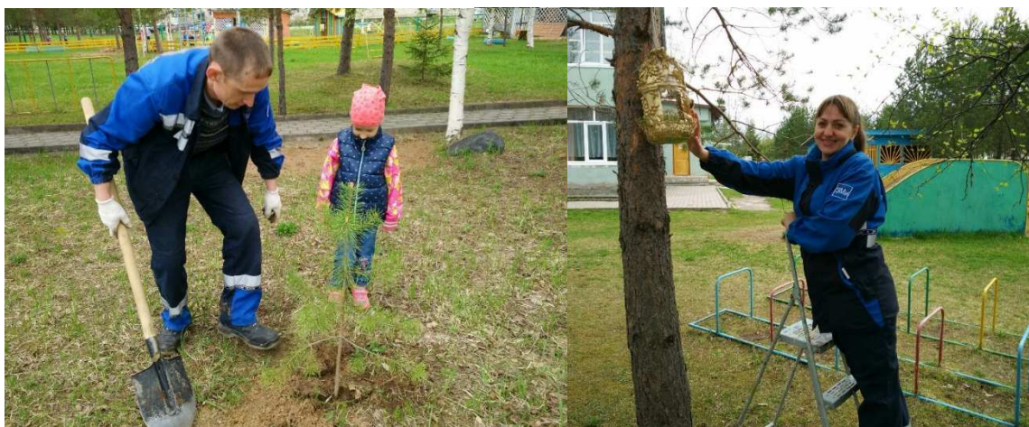
Высадка деревьев в детском саду