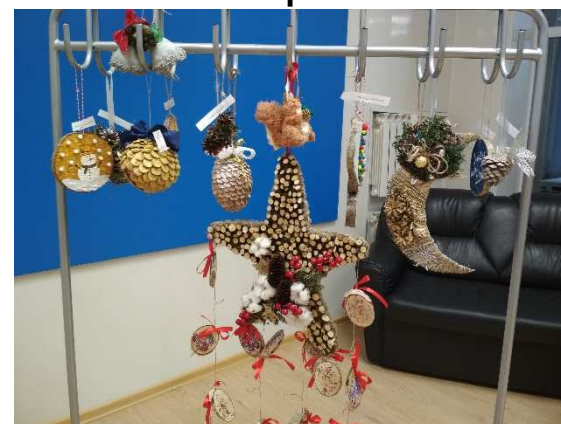
Новогодняя игрушка из природных материалов