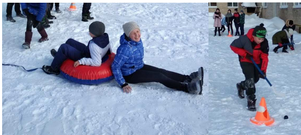
20.06.2019г. Юбилейной СОШ «Веселые старты»

01.03.2019г. Юбилейная СОШ «Снежный ком»