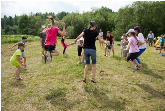
«Сказка моей мечты»