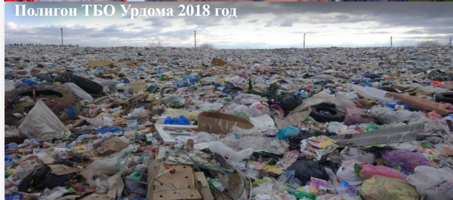
Полигон ТБО Урдома 2018 год