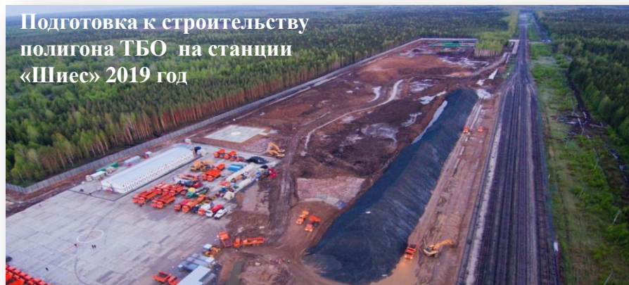
Подготовка к строительству полигона ТБО на станции «Шиес» 2019 год

К еще более осознанному отношению к сфере обращения с отходами участники группы «Чистая Урдома» пришли после известий о планируемой постройке полигона ТБО для захоронения отходов Москвы и Московской области на станции Шиес. Под полигон предполагалось занять 3000 Га - это огромная цифра, которая заставила всех жителей Урдомы задуматься и более серьезно подойти к проблеме обращения с отходами, ведь даже такой небольшой поселок, как наш, образует тонны бытовых отходов, вывозимых на полигон ТБО.