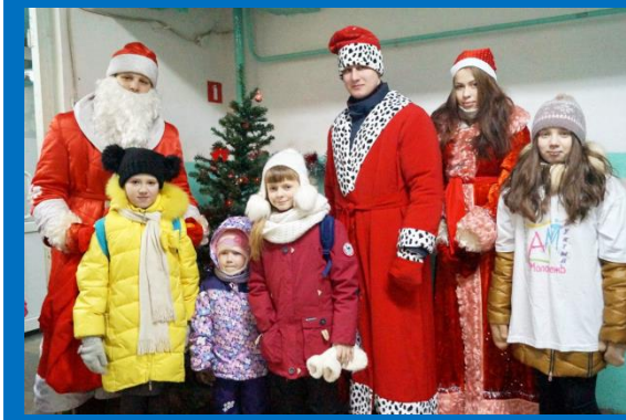
Акция «Мандариновое настроение»