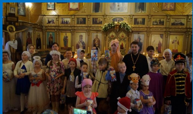
Театрализованная постановка «Рождественское чудо»