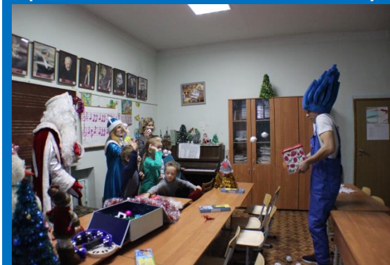
Акция «Вселенная добра» (Поздравление детей с ограниченными возможностями (объединение «Мы вместе»))