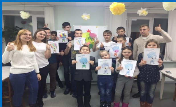
«Квест дружбы для детей оказавшихся в трудной жизненной ситуации»